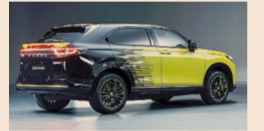
Concept car. La Honda e:NS1